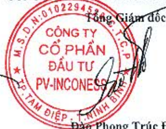
Đào Phong Trúc Đại