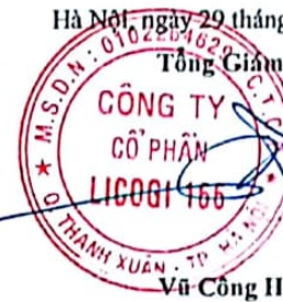
Vũ Công Hưng