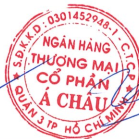
Trần Hùng Huy Chủ tịch Hội đồng Quản trị Ngày 14 tháng 8 năm 2017

Các thuyết minh từ trang 11 đến trang 88 là một phần cấu thành các báo cáo tài chính hợp nhất giữa niên độ này.