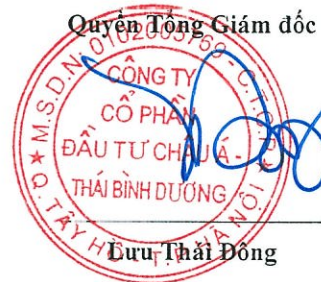
Lưu Thái Đông