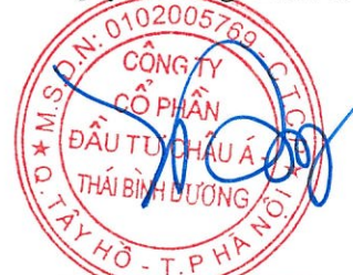
Lưu Thái Đông