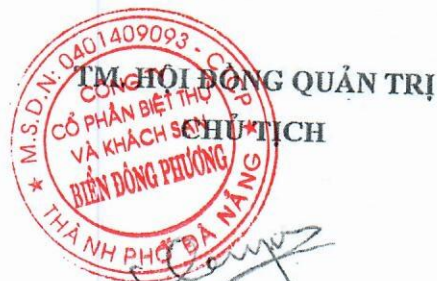
CHONG JIN FATT