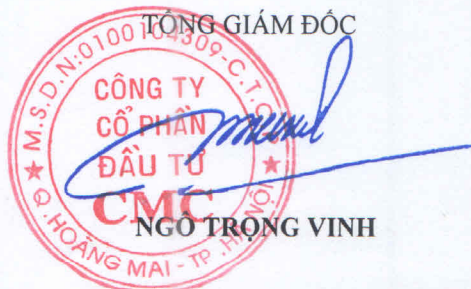
NGÔ TRỌNG VINH