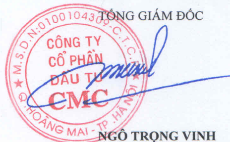
NGÔ TRỌNG VINH