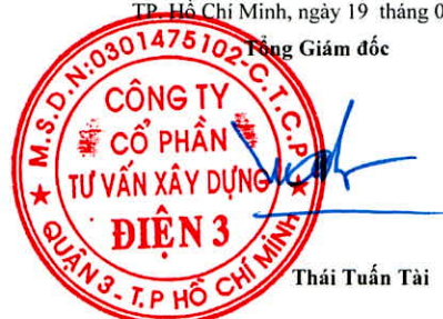
Thái Tuấn Tài