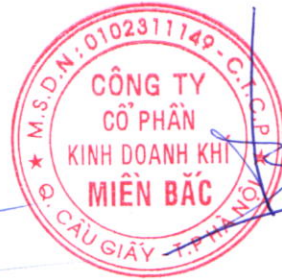
Đoàn Trúc Lâm