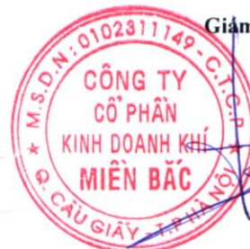
Đoàn Trúc Lâm