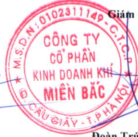
Đoàn Trúc Lâm