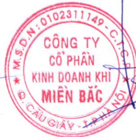
Đoàn Trúc Lâm