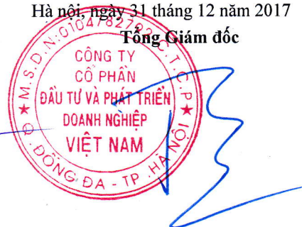
Hà Xuân Trường