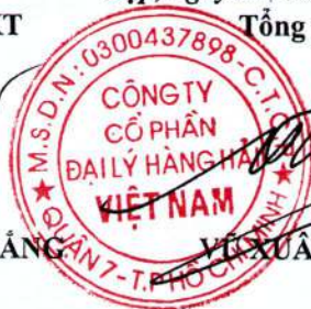
VŨ XUÂN TRUNG