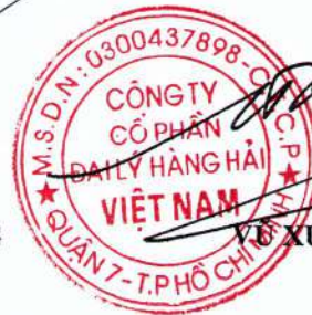
VÕ XUÂN TRUNG