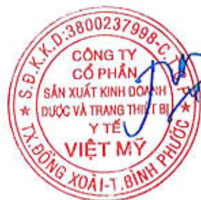
Đặng Nhị Nương