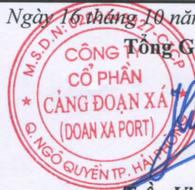
Trần Việt Hùng