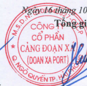
Trần Việt Hùng