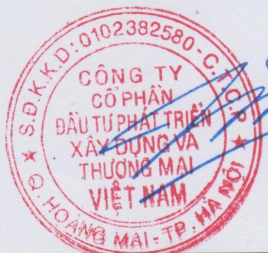
PHẠM HUY THÀNH Chủ tịch hội đồng quản trị