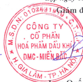
Lưu Quốc Phương