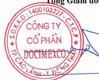
TRẦN HỮU HIỆP