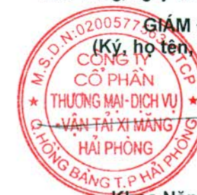
Khôa Năng Tuyên