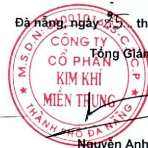
Trần NHN Thành Tuấn