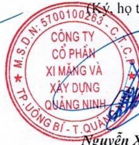
Nguyễn Xuân Quê

Ghi chú: Những chỉ tiêu hoặc nội dung đơn vị không có số liệu hoặc thông tin thì không phải trình bày và không được đánh lại số thứ tự chỉ tiêu và “Mã số”.