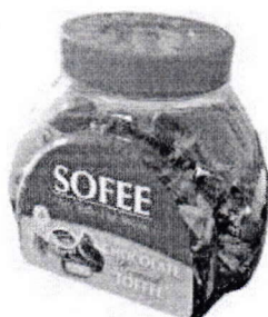
Kẹo hộp SOFEE