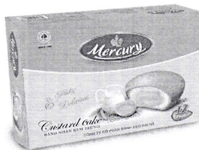
Bánh Trứng Mercury