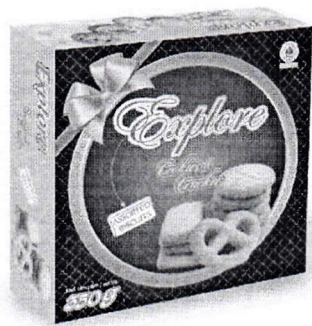
Hộp bánh Explore