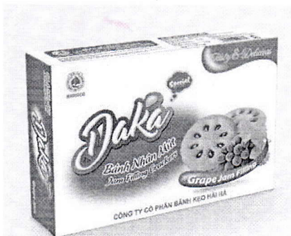
Bánh hộp nhân mứt Daka