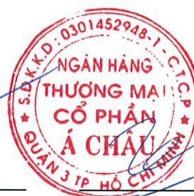
Trần Hùng Huy Chủ tịch Hội đồng Quản trị Ngày 28 tháng 2 năm 2018