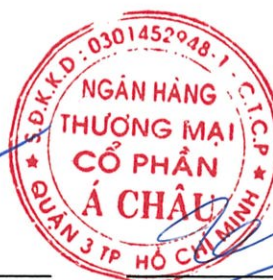
Trần Hùng Huy Trần Hùng Huy Chủ tịch Hội đồng Quản trị Ngày 28 tháng 2 năm 2018

Các thuyết minh từ trang 11 đến trang 90 là một phần cấu thành các báo cáo tài chính hợp nhất này.