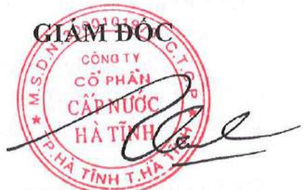
Võ Ngọc Vinh

Trên đây là kết quả sản xuất kinh năm 2017 và phương hướng, nhiệm vụ sản xuất kinh doanh năm 2018 của Công ty Cổ phần cấp nước Hà Tĩnh kính trình đại hội./.