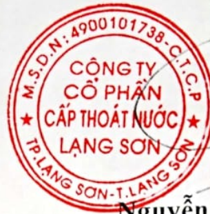
Nguyễn Văn Quyết