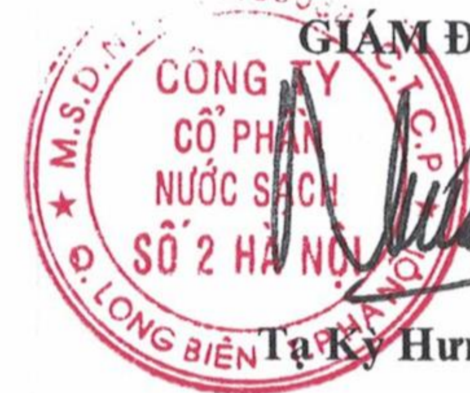
Tạ Kỳ Hưng