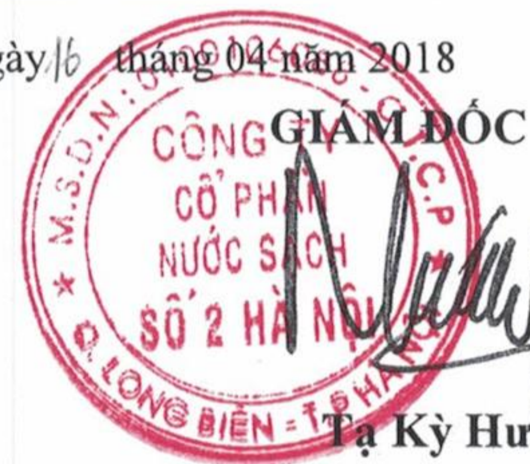
Tạ Kỳ Hưng