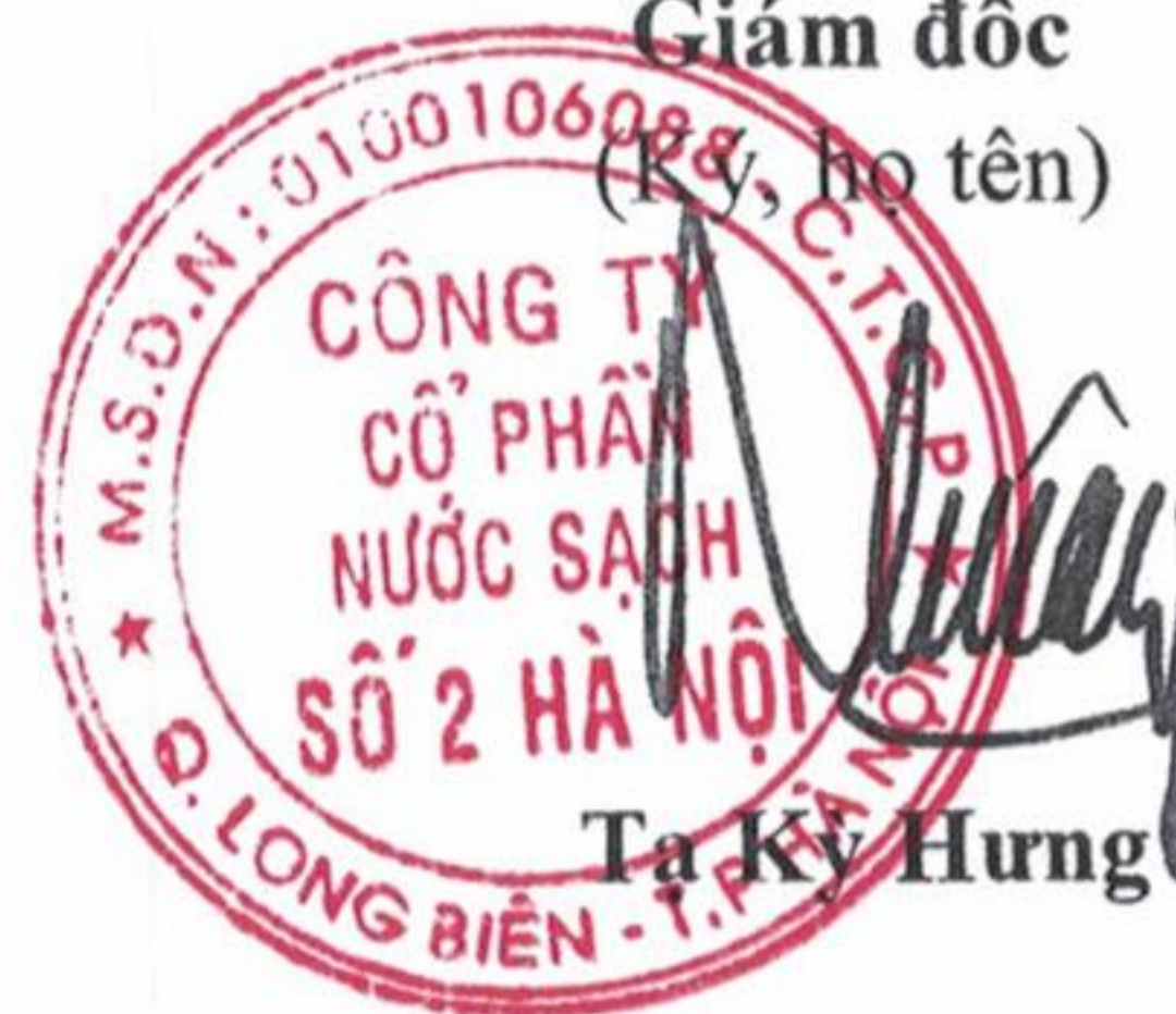
Ta Kỳ Hưng