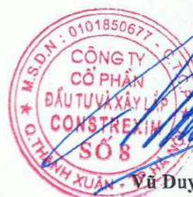
Vũ Duy Hậu

(Các thuyết minh từ trang 10 đến trang 31 là bộ phận hợp thành của Báo cáo tài chính này)