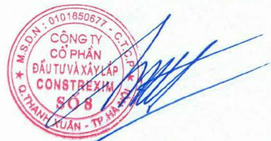
Vũ Duy Hậu

(Các thuyết minh từ trang 10 đến trang 31 là bộ phận hợp thành của Báo cáo tài chính này)