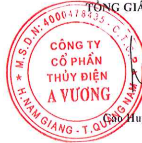
Cao Huy Bảo

EVN_GL_004B_TT200, người in: LENP.GE2.AVC, ngày in: 17/04/2018 08:28:08.