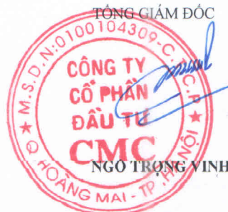
NGÔ TRỌNG VINH