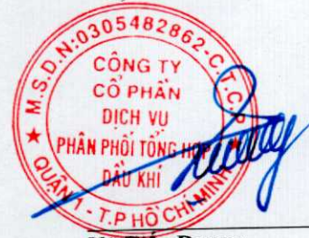
Vũ Tiên Dương Chủ tịch hội đồng quản trị