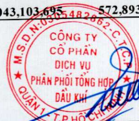
Vũ Tiến Dương Chủ tịch hội đồng quản trị