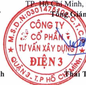
Trần Tuấn Tài