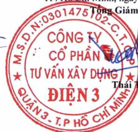
Thái Tuấn Tài