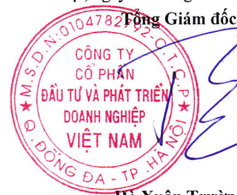
Hà Xuân Trường