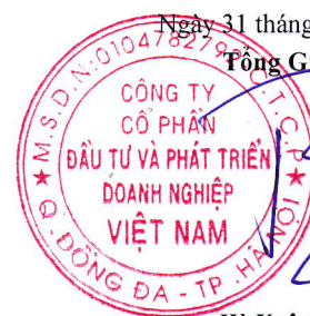
Hà Xuân Trường