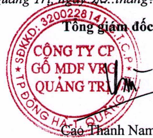
Cao Thành Nam