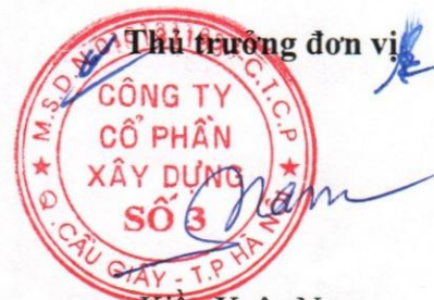
Kiều Xuân Nam