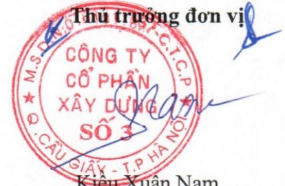
Kiều Xuân Nam