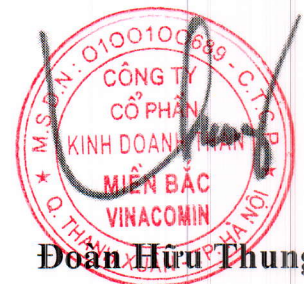
Đoàn Hữu Thuận