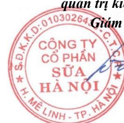
HÀ QUANG TUẤN