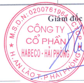
Đỗ Châu Tuấn