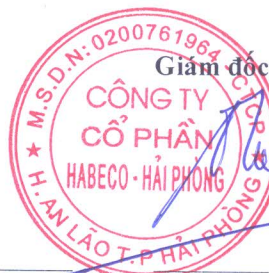
Đỗ Châu Tuấn