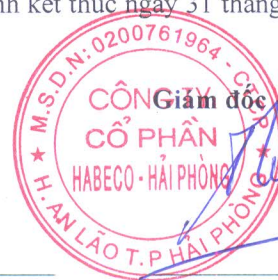
Đỗ Châu Tuấn