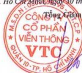
LÊ XUÂN TIẾN