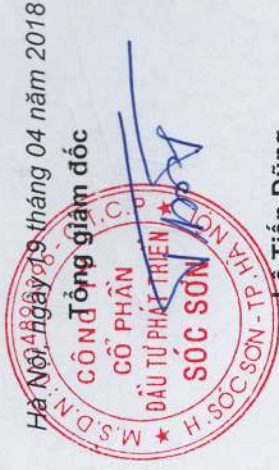
Le Tiến Dũng