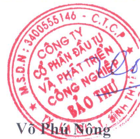
Võ Phú Nông

Tài liệu đính kèm: Nghị quyết HĐQT số 86 /2018/BIDICO/HĐQT/NQ ngày 15 tháng 05 năm 2018.