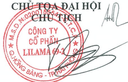
Trương Đức Thành