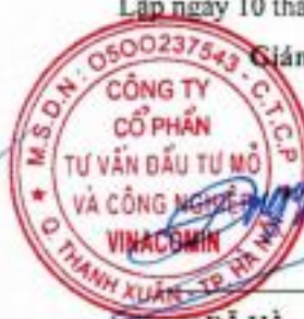
Phùng Đức Trường