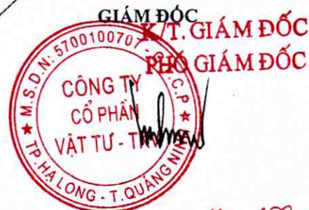
HOÀNG XUÂN TÙNG