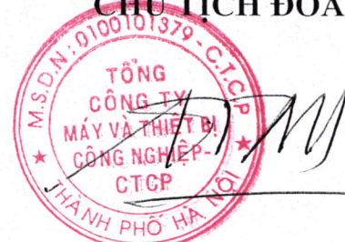
Trần Quốc Toàn