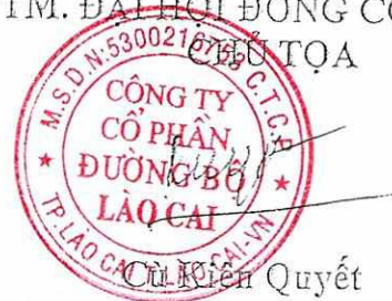
Cù Kiên Quyết