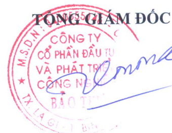
Võ Phú Nông