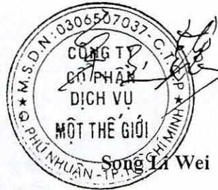
Song La Wei