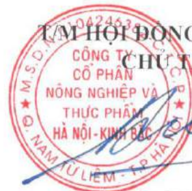
DƯƠNG QUANG LƯ