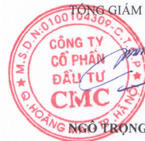
NGÔ TRỌNG VINH