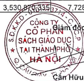
Cần Hữu Hải