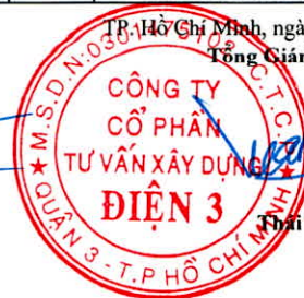
Trần Tuấn Tài