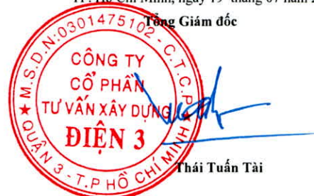
Thái Tuấn Tài