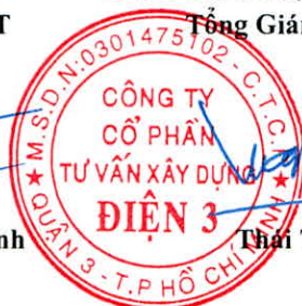
Thái Tuấn Tài