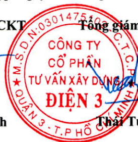
Thái Tuấn Tài