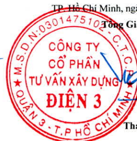
Thái Tuấn Tài