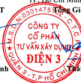
Trái Tuấn Tài